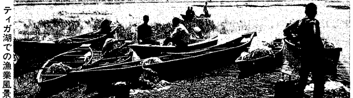
ティガ湖での漁業風景

逆に、カノ・リバー計画外の地域、カノ北東20キロメートル程の小規模なジャカラ・ダム周辺では、土盛りによる水路が主であった。ここでは、水路の一角を壊すことで、簡単に水を引く（盗む？）ことが可能である。また、ダムにためた水を自然の川に再放流する方法が採られた